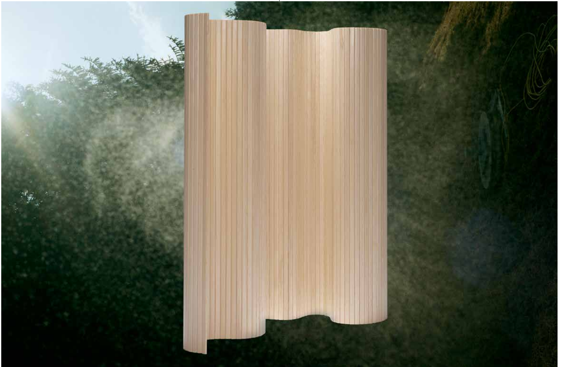
Alvar Aallon vuonna 1936 suunnitteleman muunneltavan, puisen 100 säleseinän pehmeä muotokieli yhdistyy lakatun männyn luonnolliseen tuntuun.