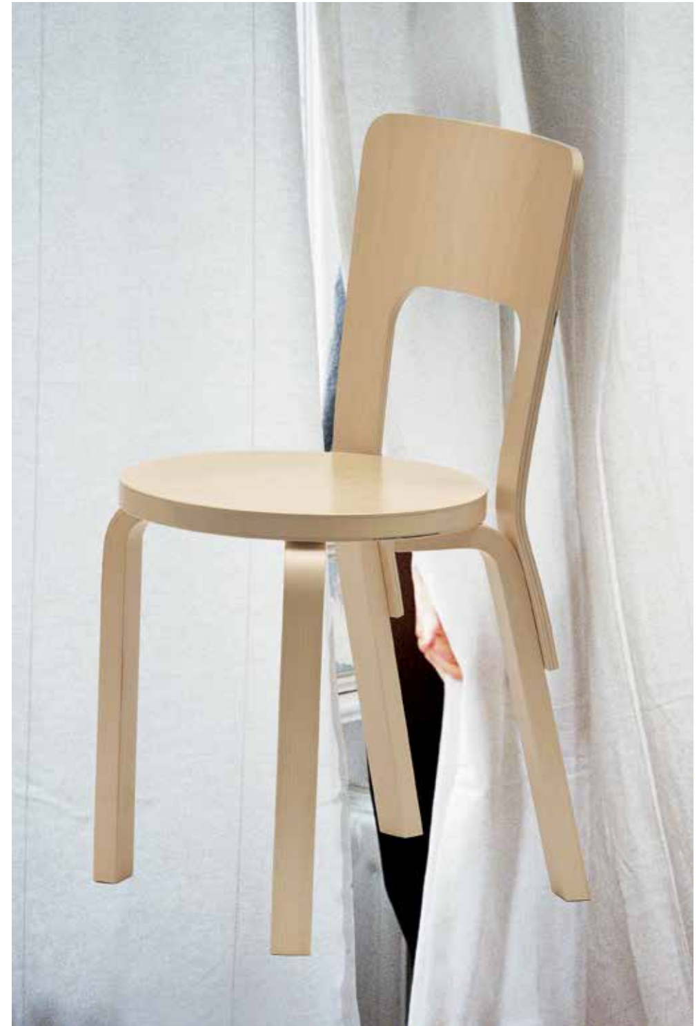
Suomen metsistä kaadetuista koivuista valmistetut Artekin tuolit ja jalkarat ovat yhtä ainutlaatuisia kuin puu, josta ne ovat valmistettu. Kuvassa tuoli 66, Alvar Aalto 1935.

verrattain matala teollistumisaste. Aalto teki järkipäätöksen valitessaan puun materiaaliksi, mutta hän oli myös ihastunut sen luontaisiin ominaisuuksiin. Aalto halusi osoittaa puun soveltuvan taivutettavaksi yhtä hyvin kuin metalli. Yhdessä taitavien puuseppien kanssa Aalto kehitti muun muassa klassikoksi muodostuneen L-jalan . Artekin valmistustavat kytkeytyvät yhä, 80 vuotta myöhemmin, materiaalin ominaisuuksiin. Esimerkiksi Tankkituolin ( nojatuoli 400 ) käsinojat valmistetaan samasta rungosta, jotta puun tiheys olisi sama. Artekissa puun luonnollista epäsäännöllisyyttä pidetään pikemminkin hyvänä kuin huonona puolena.