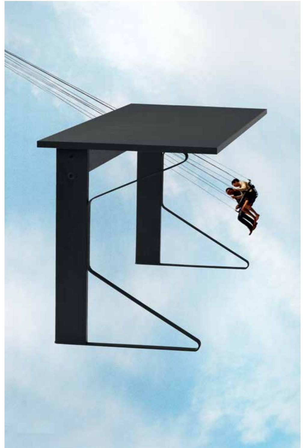
Bouroullecin veljesten Kaari-pöydässä taivutettu metalli tukee massiivipuuta ja silhuetti on ainutlaatuisen ilmava.

kuormitus kannatellaan puuosalla. Pöytä tuetaan taivutetulla metallilla elegantisti ja ilmastisesti. Tukeva pystysuora puu ja taivutettu metalli yhdessä luovat keveyden tunningin ja ainutlaatuisen graafisen kuvion. Kaari-sarjan pinnat ovat linoleumia ja korkeakiiltoista laminaattia. Nuo materiaalit patinoituvat kauniisti ajan myötä. Bouroullecin veljesten muotoilu on tuotetta, mutta – kuten kaikki Artekin tuotteet – ne kestävät eliniän.