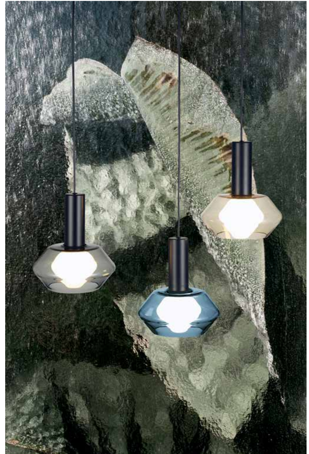
Kolmessa alkuperäisvärissä uustuotantoon otettu Tapio Wirkkalan puhallettu lasivarjostin toistaa valonlähteen muotoa. Lasivarjostimet saatavana 2016.

Wirkkalan merkkivuonna 2015 Artek tuo uustuotantona valikoimaan lasivarjostimen , jonka Wirkkala suunnitteli täydentämään timantinmuotoista polttimoa. Lasivarjostimen valmistavat mestaripuhaltajat, jotka pystyvät työstämään materiaalin äärimilleen. Läpikuultavan ohut lasivarjostin on osoitus vahvan ammattitaidon yhdistämisestä verrattain arkiseen tuotteeseen. Korkealaatuisena, käsityötä hyödyntävänä tuotteena valaisin tavoittaa täydellisesti Artekin hengen.